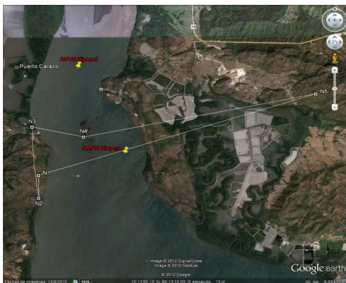
(Así reformado mediante AJDIP/245-2012)